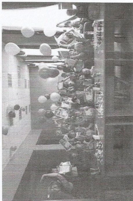
Информационная карточка программы